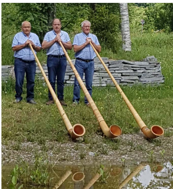
Alphorngruppe an der Thur